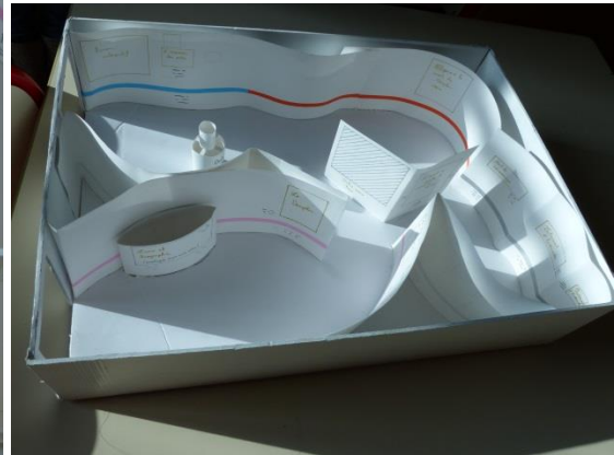
Maquette de Danaé et Marine