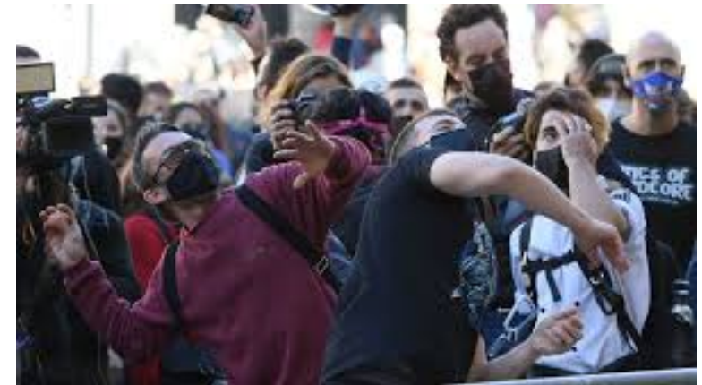
Los manifestantes arrojaron huevos a la fachada de la Generalitat.