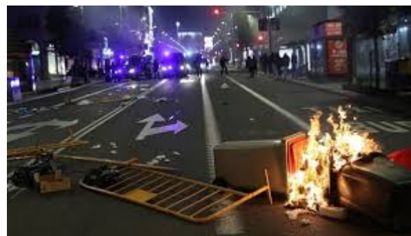
Los actos de vandalismo y saqueos