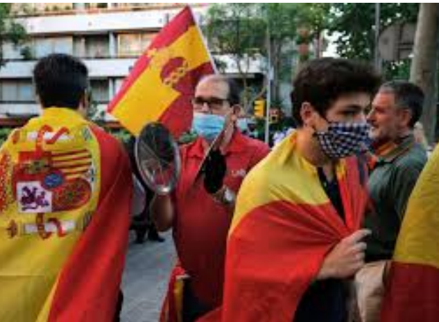
Las protestas en Madrid.

Podemos observar una ola de protestas en las calles